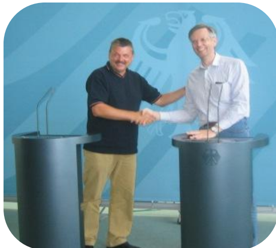
Besuch im Bundeskanzleramt

Unsere Kundenbegeisterungsprogramme hinterlassen einen nachhaltigen, positiven Erinnerungswert bei den Teilnehmern.